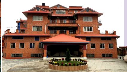
NTC College Buildings